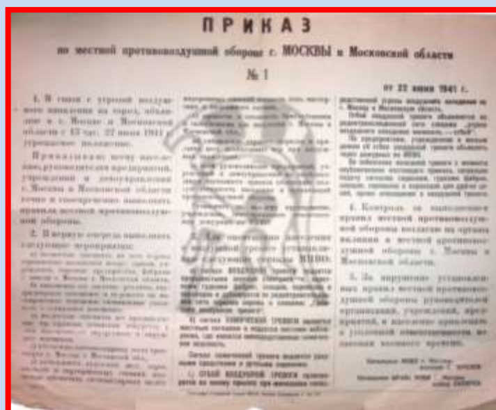
Приказ о МПВО №1 от 22.06.1941 года

В задачи МПВО входило не только тушение пожаров и организация укрытия населения в бомбоубежищах, но и множество тяжелой и не слишком приятной работы - заготовка дров для больниц и детских садов, организация эвакуации нетрудоспособного населения, оказание помощи пострадавшим при бомбежках и захоронение тел погибших.