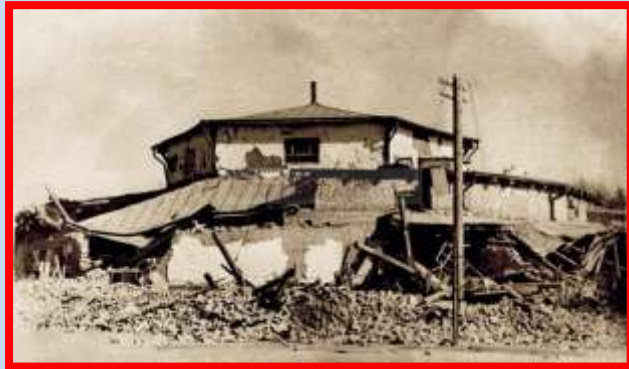
Землетрясение 1948 года в Туркмении

В ночь с 5 на 6 октября 1948 года на территории Туркменской ССР произошло одно из наиболее губительных землетрясений, известных мировой истории.