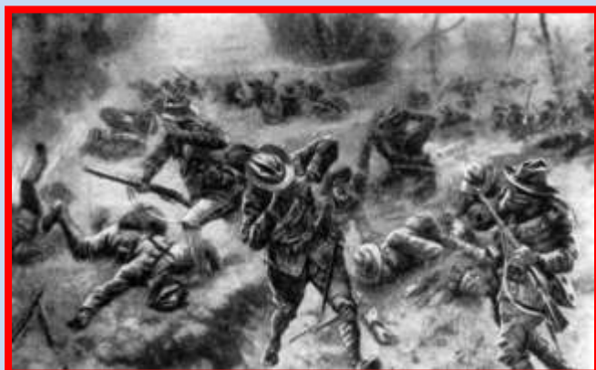
Газовая атака под Ипром 1915 года

Мирному населению на протяжении всей истории существования грозят различные опасности, в том числе связанные с боевыми действиями. За последние пять с половиной тысячелетий на земле прогремело около 15 тыс. войн, в которых погибли более 3,5 миллиардов человек. Средства поражения постоянно совершенствуются. Научно-технический прогресс привел к появлению оружия массового поражения: 22 апреля 1915 года впервые в истории войн немецкой армией было применено химическое оружие в виде газовой атаки хлором, жертвами стали 5 тыс. французских и бельгийских солдат.